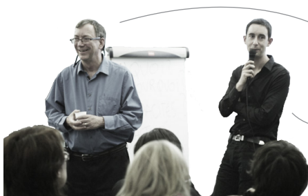
Professeur Cameron Camp Initiateur de la Méthode Montessori Adaptée ©

Suivez trois jours de formation de base à la Méthode Montessori© pour trouver des réponses concrètes aux problématiques de l'accompagnement des personnes âgées atteintes de démence. Présentée par :